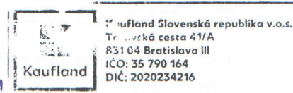
Kaufland Slovenská republika v.o.s.